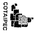
CUADRO DETALLADO DE SOLICITUDES DE INFORMACIÓN

Sistema de Atención a Niños, Niñas y Adolescentes Formadores Dependientes del Estado "Voto Nuevo" (S2)